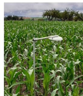
Mesures de la volatilisation ammoniacale à Haroué (54)

La multiperformance des systèmes de culture testés est évaluée à partir de mesures au champ (azote dans le sol et les plantes, volatilisation d'ammoniac et protoxyde d'azote) mais aussi grâce à des outils de simulation permettant d'évaluer les pertes d'azote dans l'eau et dans l'air comme Syst'N®.