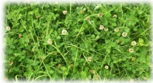
Mélange à base de ray-grass anglais- Trèfle blanc implanté pour 4 à 5 ans

Il n'est pas rare de retrouver des espèces de courte durée dans des mélanges "longue durée". Attention, si elles sont présentes en trop grande quantité, elles risquent de prendre le dessus sur les espèces plus lentes d'implantation. Préférez donc un ensemble d'espèces de même catégorie de pérennité.