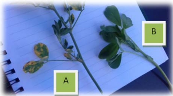
A : Verticilliose sur luzerne Variété sensible B : Pied de luzerne sain

90% des pieds de luzerne atteints : obligation de retournement car pas de traitement possible sur le champignon.