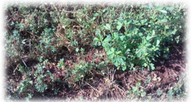
1 pied sain dans une parcelle malade à 90% !

Le choix d'une variété résistante aux maladies c'est s'assurer de la pérennité de sa prairie !