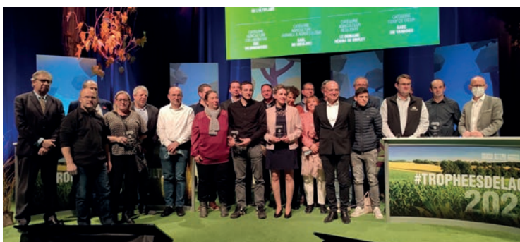
7 entreprises agricoles lauréates des premiers Trophées de l'agriculture

Renforcer la visibilité de l'agriculture, se montrer proactif sur l'ensemble de nos canaux de communication ont été les objectifs menés par la communication, afin de faire connaître l'action de la Chambre d'agriculture auprès de ses ressortissants, ses partenaires, du monde politique et du grand public. Temps fort agricole, l'événement organisé autour de la moisson a été largement relayé. En septembre, l'Elevage en fête à Lunéville a marqué, malgré des contraintes fortes, un retour à la convivialité apprécié des exposants, comme des visiteurs avec une belle fréquentation. Un succès qui a également été au rendez-vous de la première édition des Trophées de l'agriculture au mois de novembre. Une cérémonie, en présence de Louis Bodin, a permis de récompenser 7 exploitations agricoles pour leurs pratiques innovantes, résilientes ou vertueuses d'un point de vue environnemental ou de la vie des territoires devant plus de 200 personnes réunies à Pont-à-Mousson.